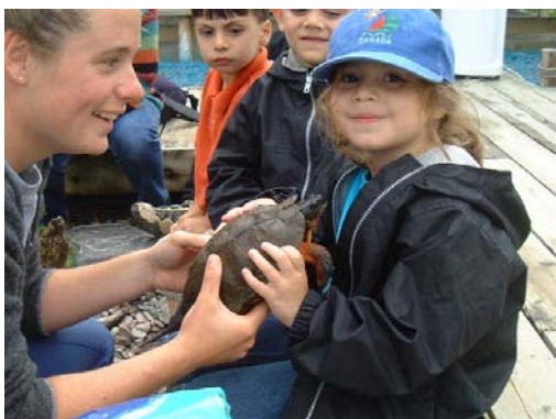
Cette photographie exprime bien le slogan du Centre de la biodiversité Venez voir, toucher et sentir la biodiversité !

Du point de vue économique, ce sont d'importantes retombées que le Centre de la biodiversité génère à chaque année. En 2006, près de 12 000 visiteurs ont franchi les portes du Centre pour aller y explorer les différentes expositions ou, tout simplement, pour y rencontrer dame nature de plus près, en y parcourant les différents sentiers qui mènent à la forêt ou sur le bord des marais. C'est également 5 employés, à temps plein, et 2, à temps partiel, qui entretiennent le Centre et organisent les diverses activités annuelles.